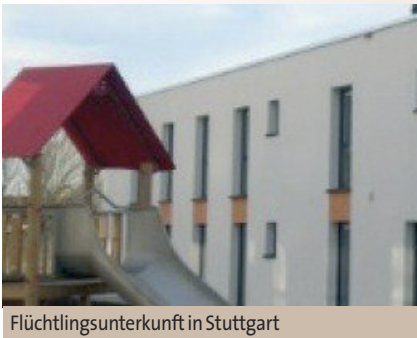
Flüchtlingsunterkunft in Stuttgart

Welche Verhältnisse herrschten eigentlich vor 125 Jahren, dem Gründungsjahr der SPD Möhringen? Es war die Hungersnot, die absolute Existenzangst, die hunderte Möhringer zum Auswandern veranlasste.